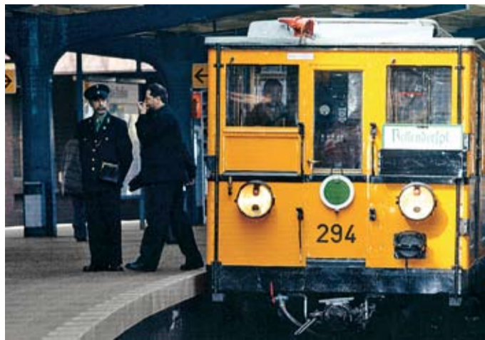
Ein seltener Anblick: „Historisches“ auf den Schienen. Foto/Buch: Donath

Fortunas Segen hoffen. Der Legendensoll die Nonne allein durch ein Gebete eine verheerende Mäuse- und Rattenplage beendet und damit die Ernte der Bauern gerettet haben. Kühnel räumt auf mit dem Aberglauben, dass das Mittelalter finster war und Berlin im Dunkeln versank. Den Beweis liefert sie mit Wissenswerten über den historischen Kern der Stadt, mit Zahlen und Fakten, aber auch Anekdoten vom Nikolaiviertel bis zur Marienkirche und zur Schwesternstadt Berlins, der Fischerinsel Cölln. Selbst nach „auswärts“ – nach Spandau – führt der Weg. Und nicht nur zur Zitadelle. Die Stadt bietet weit mehr. star Steffi Kühnel: Civitas Berolinensis , Vergangenheitverlag, 13,90 Euro, 978-3-940621-14-6